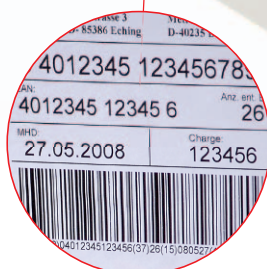
Pallet en doosetikettering