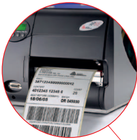
Orderpicken / verpakken